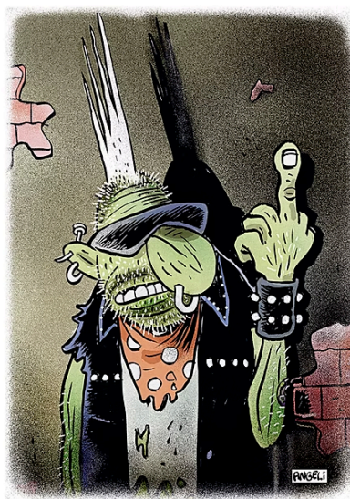
Figura 4 – Representação de Bob Cuspe como ícone gráfico autônomo.

Descrição: O personagem aparece descontextualizado, simbolizando o esvaziamento crítico e a mercantilização da arte.