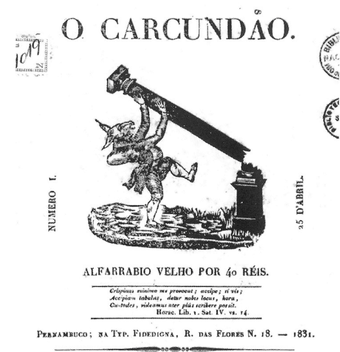
Figura 1 – Capa da publicação O Carcundão (Pernambuco, 1831). Descrição: Personagem corcunda com cabeça de burro, representando a incultura das elites brasileiras do período.