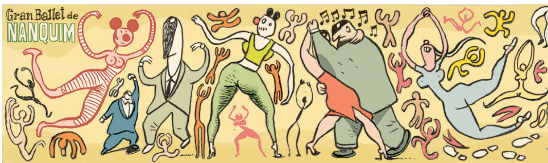
Figura 3 – Angeli em processo de transição criativa, explorando desenhos e rabiscos livres.

Descrição: Produções experimentais posteriores ao afastamento do formato de tiras.