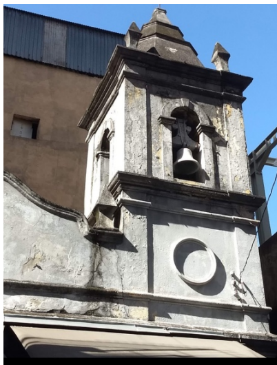
Torre e sino da Capela dos Aflitos. 2020

Ambas as histórias coexistem até hoje no bairro como duas realidades paralelas que se sobrepõem sobre a outra, embora apenas uma delas tenha reconhecimento; o que nos leva ao foco deste artigo: a discussão da sustentabilidade cultural de um bairro, onde mesmo com histórias e culturas tão distintas entre si, como que elas podem coexistir sem que uma tenha mais foco do que a outra. Trata-se, portanto, de uma discussão da paisagem urbana da região central de São Paulo; a qual consequentemente torna-se pertinente para os debates de urbanismos contemporâneos, sendo que tal situação pode ser observada em várias metrópoles ao redor do mundo; tal qual a Chinatown de Nova Iorque e Montreal, Little Havana e Little Haiti em Miami, Phahurat em Bangkok; entre tantas outras.