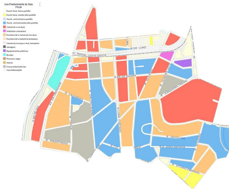
Mapa 02- Uso e Ocupação do Solo