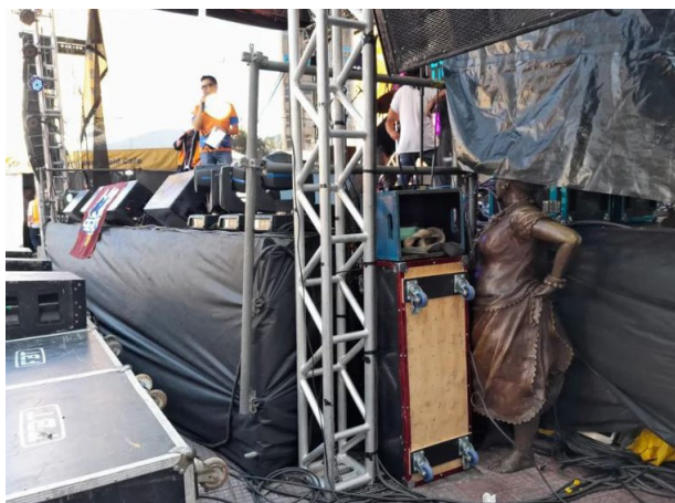
Estátua escondida pelo palco do Festival da Cultura Geek

Em relação às iniciativas mais recentes por parte do poder público, entre 2022 e 2023, a Prefeitura Municipal de São Paulo tem intervindo nesse espaço público com projetos diversos, mas sem uma ação específica para contribuir de forma direta a evidenciar a pluralidade existente no bairro. A iniciativa mais recente foi o projeto