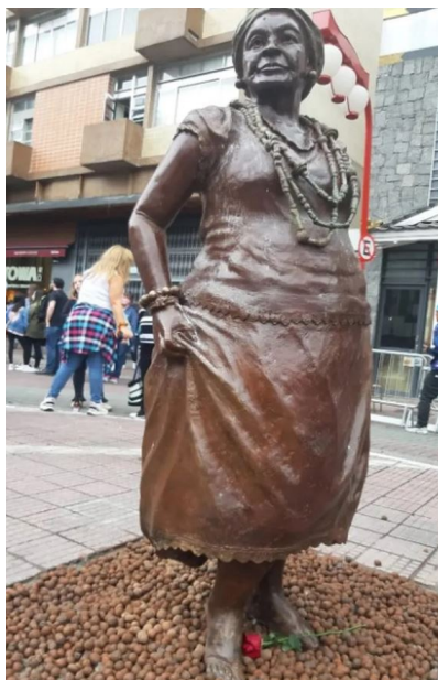
Estátua de Madrinha Eunice, implantada na Praça da Liberdade