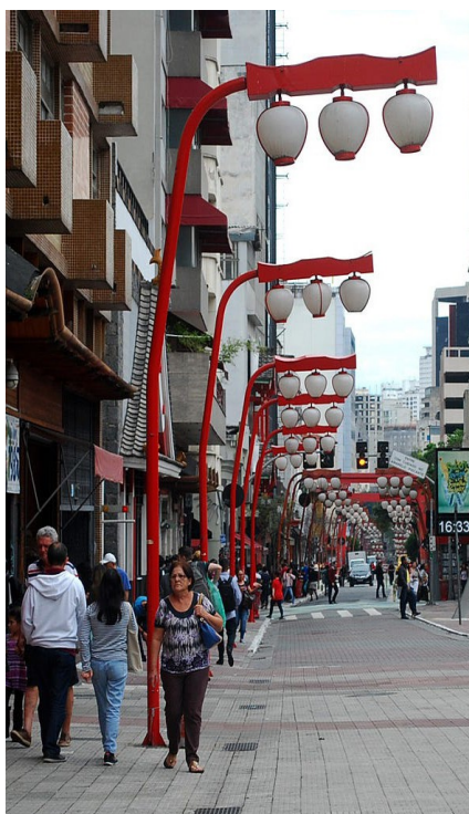
Luminária Japonesa na Liberdade

O título de Asiatown não é a toa: desde 1912 o bairro já chegou a comportar a maior colônia japonesa do mundo fora do Japão e atualmente além dos japoneses também conta com chineses e coreanos morando em seus arredores; o que atrai todo o contingente de pessoas que são interessadas na cultura asiática, seja através da comida, das lojas que ven- dem artigos importados asiáticos ou até mesmo de eventos culturais que acontecem no bairro de tempos em tempos.