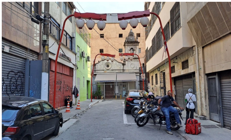
Foto do Beco dos Aflitos atualmente.