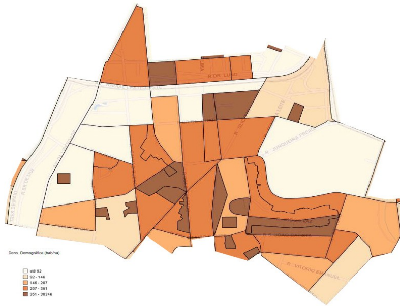
Mapa 1- Adensamento Urbano