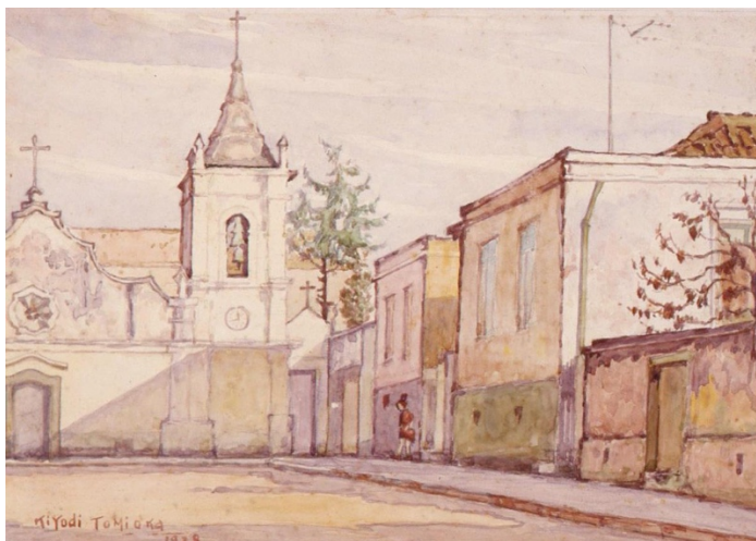
Rua dos Aflitos - Aquarela sob papel, Tiyodi Tomioka - 1928

Porém também deve-se prestar atenção de que não se trata de construir uma “Liberdade temática” onde se separa a Liberdade Asiática com as lanternas japonesas e a Liberdade Africana se utilizando do mesmo tipo de alegoria, deve-se atentar que o principal cuidado ao se tratar do bairro deve ser as sobreposições culturais que existem ao mesmo tempo no local, o que é justamente o fator que torna esse bairro tão icônico e tão importante para diferentes tipos de pessoas com diferentes histórias. A verdadeira faceta da Liberdade é como uma grande colcha de retalhos, com diferentes origens, estampas e texturas; mas todos esses retalhos estão costurados com a mesma linha, formando assim uma peça única a qual se junta com outras peças, outros bairros, estes com outras cores e histórias; formando assim o que chamamos de Cidade de São Paulo.