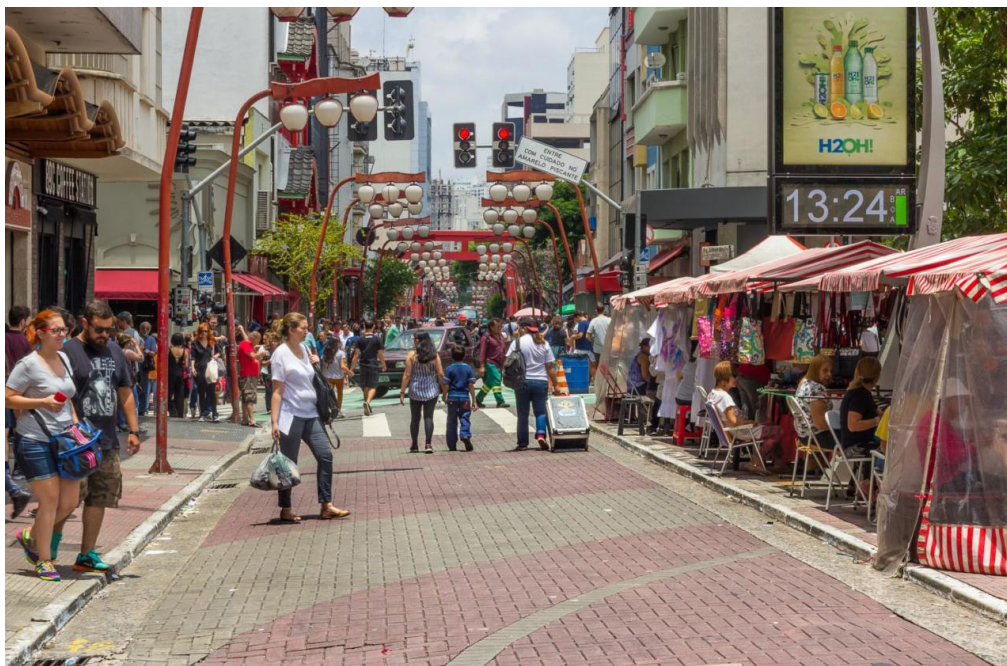
Feirinha da Liberdade no domingo