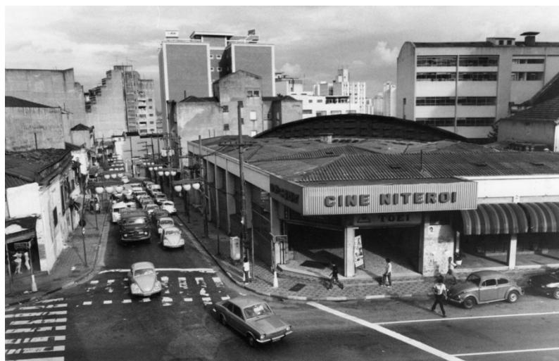
Fachada pertencente ao Cine Niterói, sem data

A presença japonesa no bairro se deu início em 1912, na rua Conde de Sarzedas, devido à grande quantidade de imóveis e porões disponíveis para aluguel a preços muito baratos. Nessa época os imigrantes japoneses trabalhavam em atividades comerciais para a própria colônia como hospedarias, empórios, fabricação de tofu, manju e firmas agenciadoras de empregos. Em 1932 eram 2 mil japoneses só na cidade de São Paulo, sendo destes 600 na Rua Conde de Sarzedas. Também havia ocupações nas ruas Irmã Simpliciana, Tabatinguera, Conde do Pinhal e Mituto Mizumoto. Em 1946, foi fundado o primeiro jornal pós-guerra japonês, o São Paulo Shimbun e em julho de 1953 foi inaugurado o Cine Niterói, localizado na Rua Galvão Bueno, contendo 5 andares com salão, restaurantes, hotel e uma sala de projeção, onde passavam filmes de produção japonesa. Com o tempo, a Rua Galvão Bueno passou a ser considerada o centro da ocupação japonesa, especialmente em torno do Cine Niterói, até que em 1964 foi inaugurada a Associação Cultural Japonesa de São Paulo, também chamada de Bunkyô, localizada na esquina da Rua São Joaquim com a Galvão Bueno.