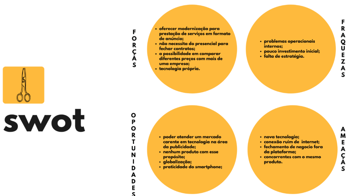
Figura 9