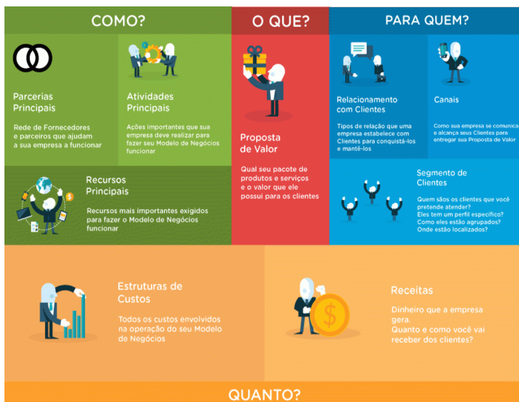
Figura 2 3

Como podemos ver na imagem a seguir uma explicação leve e didática: