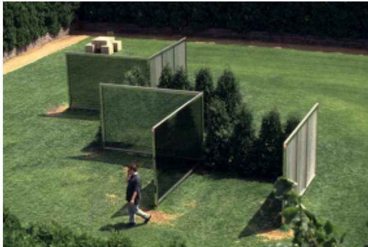
Foto 02. Two-way mirror punched steel hedge labyrinth. 1994-1996.

espelho, simulando assim outros planos e outros espaços visíveis.