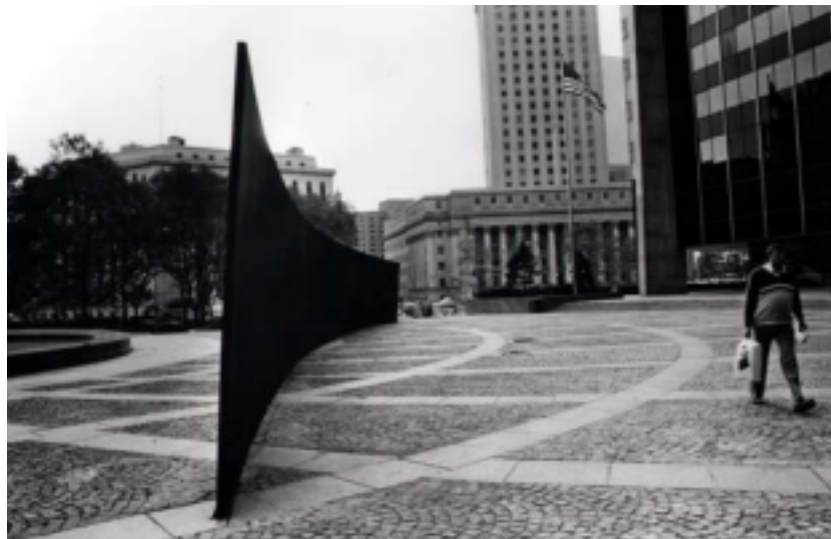
Foto 03. Richard Serra, Tilted Arc , 1981, aço, Nova Iorque (destruído).

Em Tilted Arc , (1981), produzida por Richard Serra é uma gigantesca "parede" de aço inclinada colocada na Federal Plaza, em Nova York. Essa obra, afirma o artista, "foi elaborada para um lugar específico, em relação com um contexto específico e financiada por esse contexto". Para sua elaboração o lugar é examinado em todas as dimensões: desenho da praça, arquitetura, fluxo diário de transeuntes.