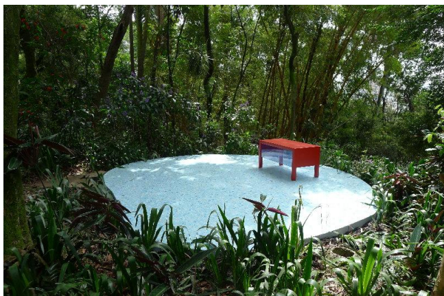
GONZALEZ-FOERSTER, Dominique. Sem Título. 2013. Vidrotil e Acrílico.

Segundo Hans Ulrich Obrist, na obra de Meireles, “o objetivo não é tirar a casa do seu lugar, ou fazer que ela não seja mais compreendida, mas trazê-la de volta à vida pelo cheiro do café. A casa é a protagonista quando, depois que a protagonista morre, de alguma forma ainda está ali.” 9