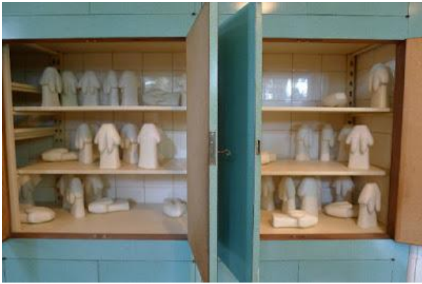
JEONG-A, Koo. Sem Título. 2013. Escultura de madeira.

A exposição foi dividida em duas fases, com o prelúdio sendo realizado no dia 05 de setembro de 2012 e a segunda fase sendo realizada no período de 05 de abril a 30 de maio de 2013. Também foi dividida em dois locais, a sede principal, Instituto Lina Bo e P.M. Bardi e a sede paralela no Sesc Pompéia.