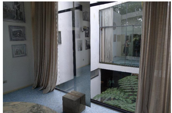
ELIASSON, Olafur. Sem Título. 2013. Cavalete de Vidro.