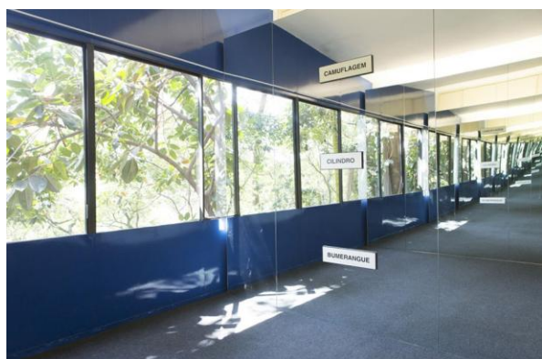
CALDAS, Waltércio. Camuflagem. 1977. Instalação.

Assim como em outros trabalhos, o curador utiliza-se do conceito de Gesamtkunstwerk , ou obra de arte total na Casa de Vidro, onde “os artistas jogam com as diferentes funções e elementos estruturais de uma casa como esta. O objetivo é a sutileza. A casa se torna um gatilho, ou um espaço de produção.” (OBRIST, 2013) 8