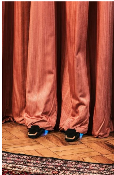
CHAVES, Marcos. Cartoon Soundtrack. 2013. Site-specific.

Além da primeira, Chaves realiza outras intervenções no espaço, como “Cinema Lavado”, “Cartoon Soundtrack”, entre outras.