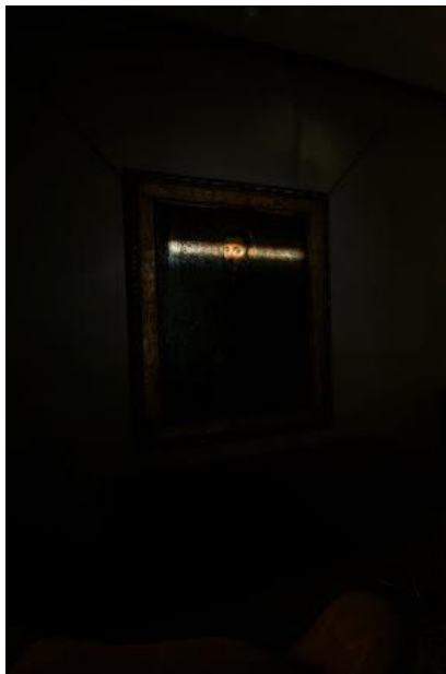
CHAVES, Marcos. I Only Have Eyes For You. 2013. Projeção.