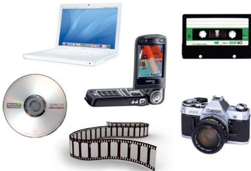
Figura 5 – Algumas das mídias possíveis para produção audiovisual.

A Saída do processo de produção audiovisual vai determinar os procedimentos utilizados para o desenvolvimento da obra audiovisual, nela serão determinadas características próprias de cada meio.