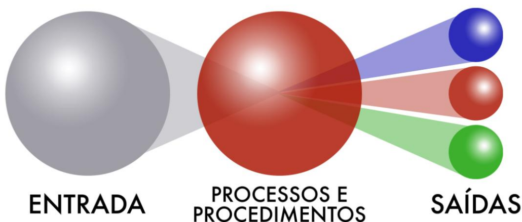
Figura 4 – Síntese visual do processo de realização da Obra Audiovisual.

Após devidamente inserida como objeto de Arte e como elemento de linguagem de Comunicação, a obra audiovisual requer uma síntese para se apresentar diante desse momento histórico em que as Novas Tecnologias estão presentes, para desenhar o caminho futuro a ser seguido e indicar suas tendências. A figura a seguir (figura 4) representa essa reflexão sobre a produção da obra audiovisual como fruto de um ato criativo que visa transmitir uma informação através de um meio qualquer.