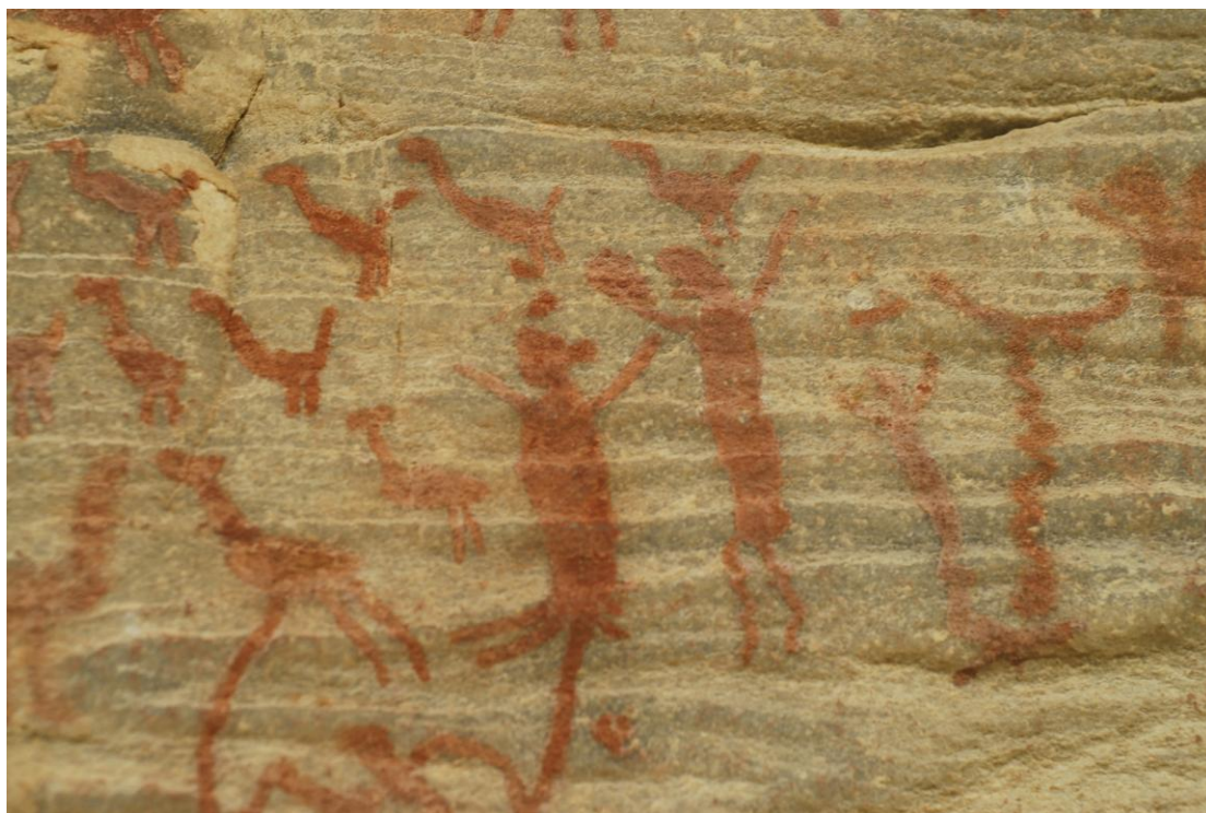
Figura 1: Pintura rupestre da região do Seridó, RN.